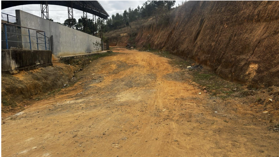
Figura 5 – Condições atuais da área no entorno do ginásio esportivo e da escola da Comunidade de Rio Muqui Pedra.