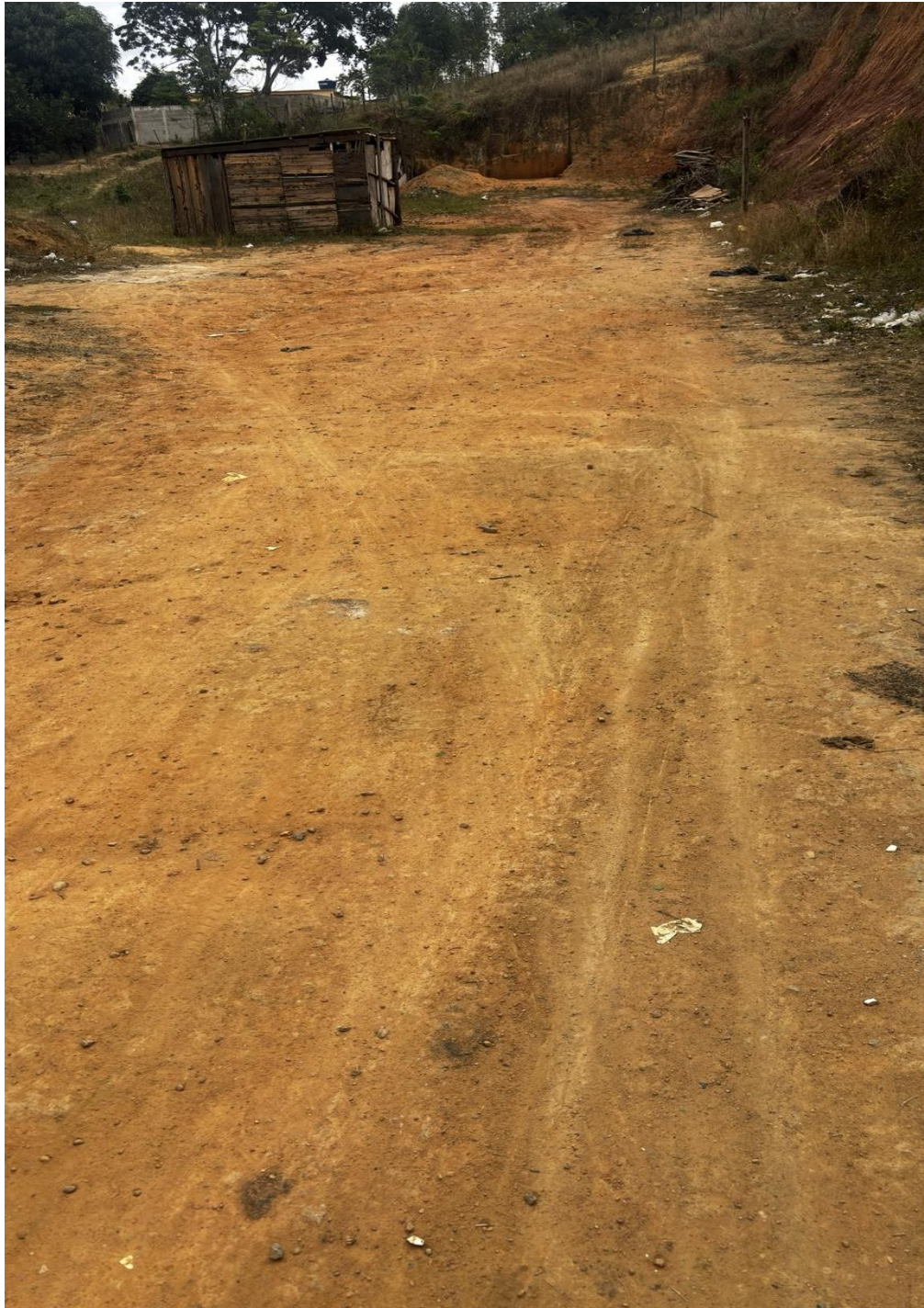
Figura 2 – Condições atuais da área no entorno do ginásio esportivo e da escola da Comunidade de Rio Muqui Pedra.