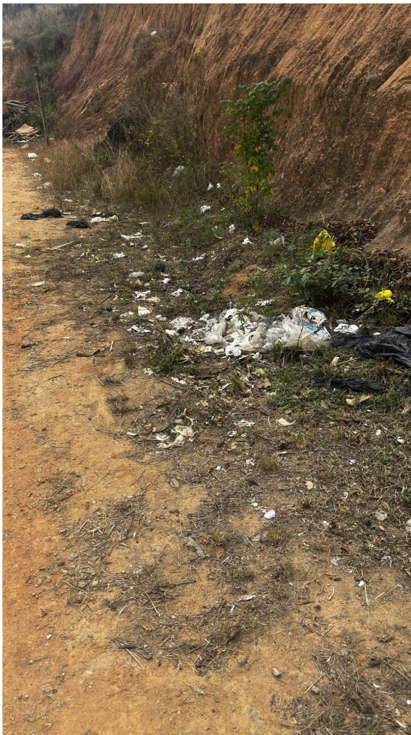
Figura 4 – Condições atuais da área no entorno do ginásio esportivo e da escola da Comunidade de Rio Muqui Pedra.