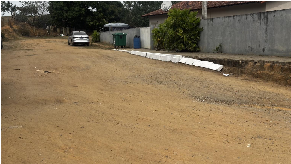
Figura 3 – Condições atuais da área no entorno do ginásio esportivo e da escola da Comunidade de Rio Muqui Pedra.