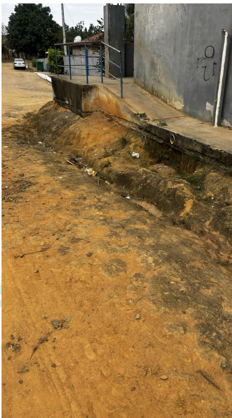
Figura 1 – Condições atuais da área no entorno do ginásio esportivo e da escola da Comunidade de Rio Muqui Pedra.