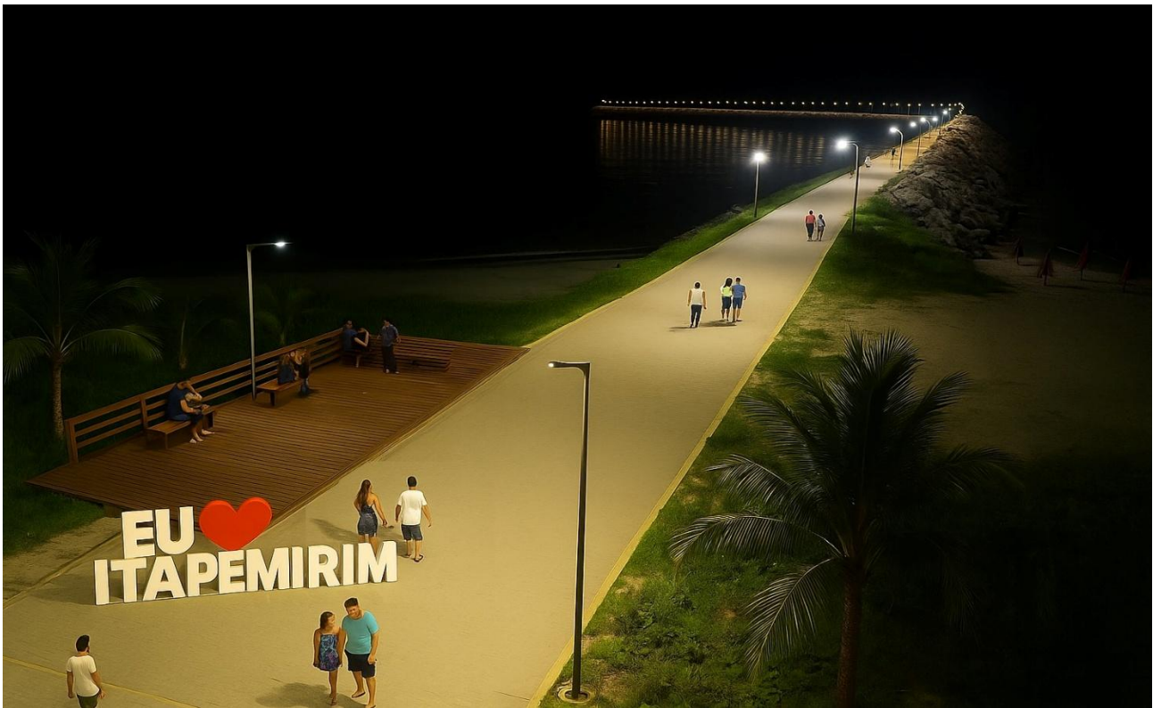
Imagem do local: