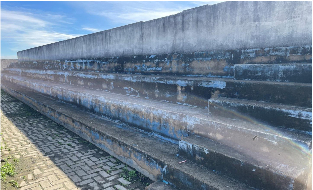
DESENVOLVIMENTO E GRANDEZA