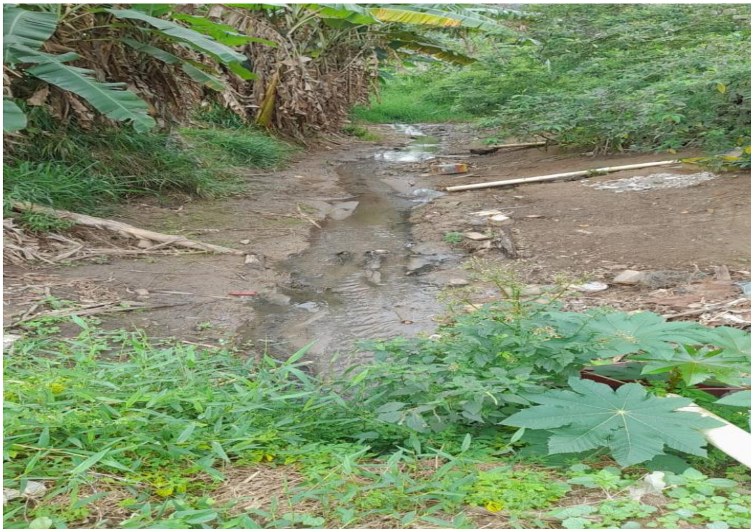
DESENVOLVIMENTO E GRANDEZA