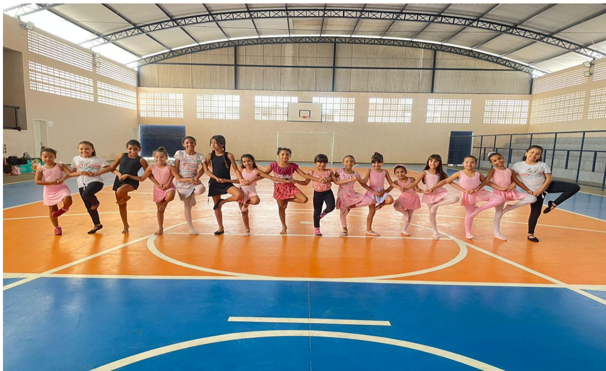
DESENVOLVIMENTO E GRANDEZA