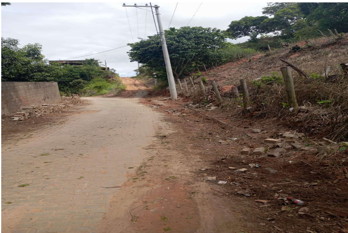
DESENVOLVIMENTO E GRANDEZA