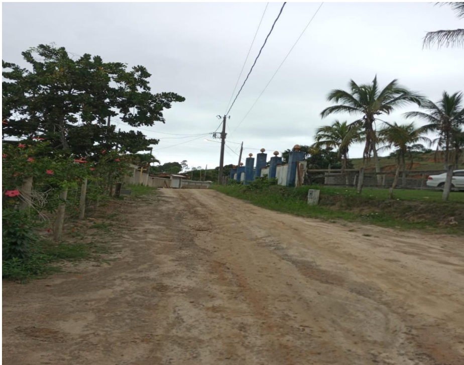
DESENVOLVIMENTO E GRANDEZA