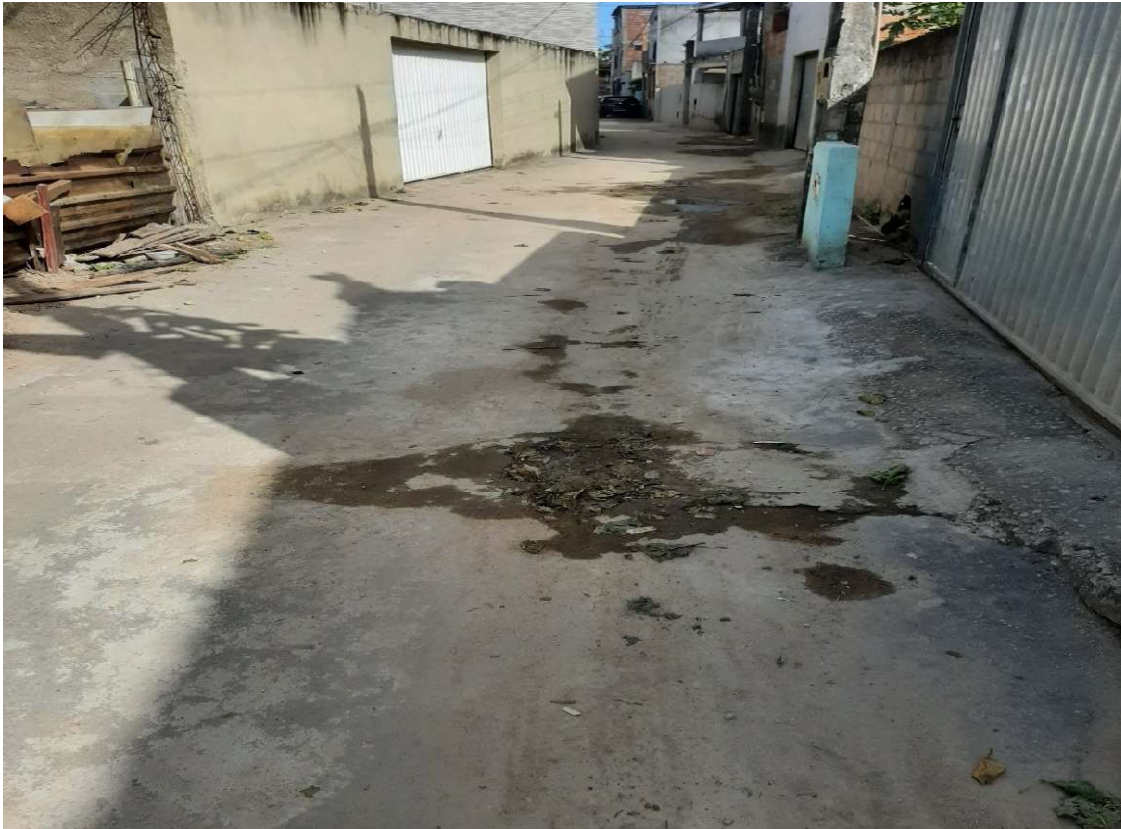
REACHAMENTO E SANIDADE