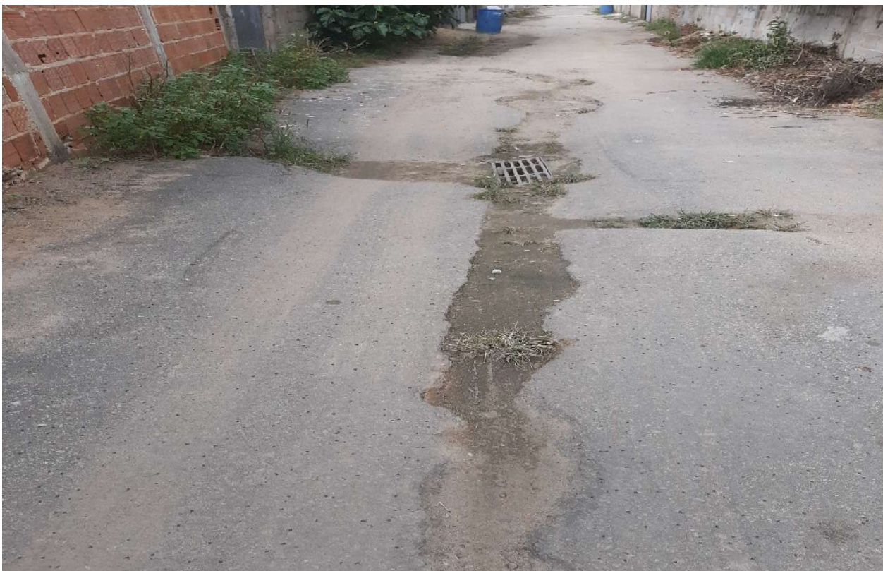
DESENVOLVIMENTO E GRANDEZA