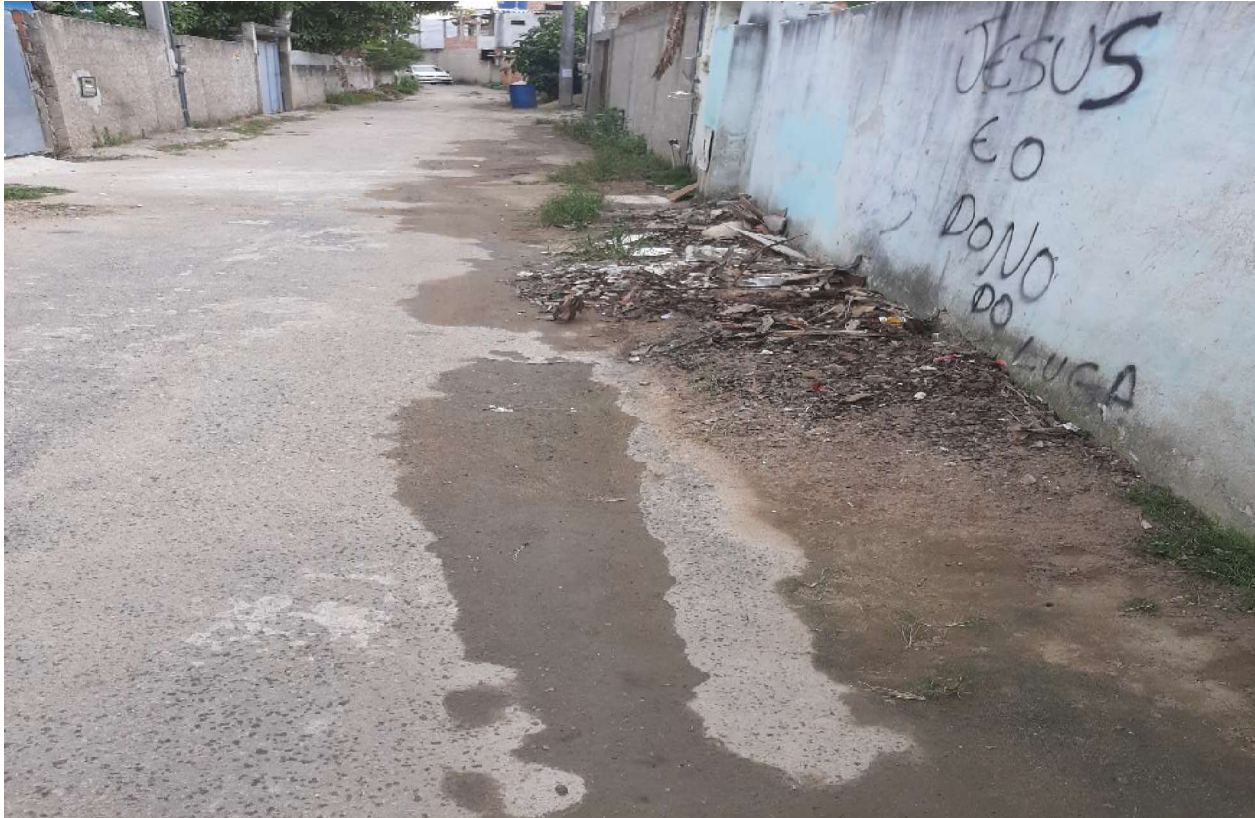
DESENVOLVIMENTO E GRANDEZA