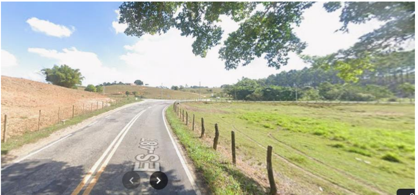
Imagem 2 – Vila sentido Piabanha do Norte